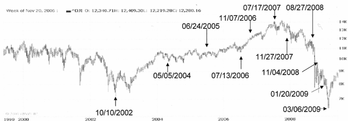
Abb. 1: Dow Jones Industrial Average (DJIA), 1. Juni 1999 – 15. Juni 2009 10

Nach einer langen Baisseperiode auf den Aktienmärkten seit dem Platzen der Internet-Blase im Jahr 2000 erreichten die Aktienkurse am 10. Oktober 2002 die Talsohle und am gleichen Tag begann mit einer kräftigen Aufwärtsbewegung eine lange Aktienhausse. Diese endete erst im Oktober 2007, nachdem die Kreditkrise schon im Juli 2007 ausgebrochen war. Die anschließende Aktienbaisse fand ein zumindest vorläufiges Ende im März 2009.