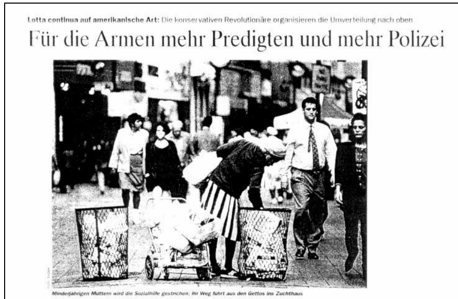
Abb. 1. Aus: Weltwoche , 2. 3.1995.

vermeiden zu wollen und ihr Gesicht drückt Unlust aus. Die Ohnmacht dieser Frau aktualisiert einerseits Gefühle der Hilflosigkeit und Abhängigkeit, andererseits aber auch die zu den aktualisierten Ohnmachtsgefühlen gehörende Wut. Diese Wut richtet sich auf das angstauslösende Objekt. Deshalb sollen, wie die Legende zu dem Bild besagt, die minderjährigen Mütter mit Streichung der Sozialhilfe und Zuchthaus bestraft werden.